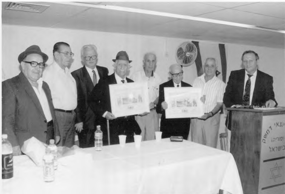
טקס רישום שמם של שני חברי ההתאחדות בספר הזוהב של הקק"ל.