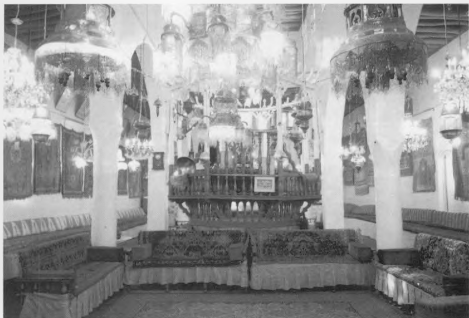
בית הכנסת ג'ובר (1994).