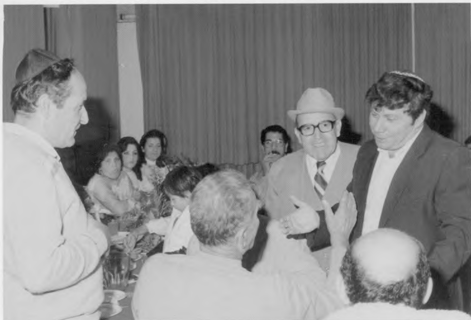
מסיבת חנוכה לעולים החדשים.