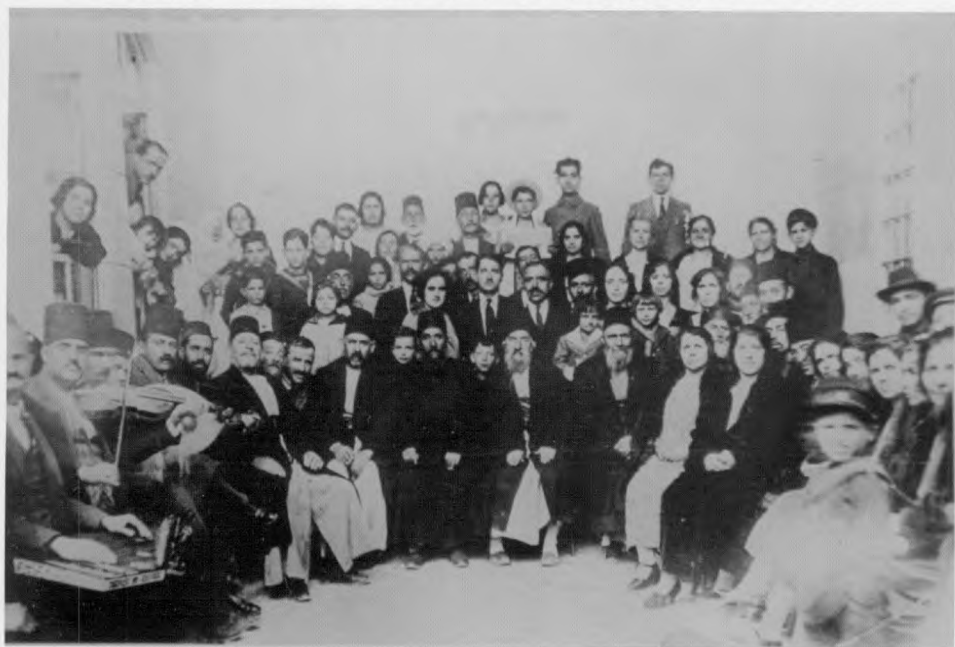
חגיגת בר מצוה בדמשק בהשתתפות הרבנים והמורים מבית ספר "אליאנס".