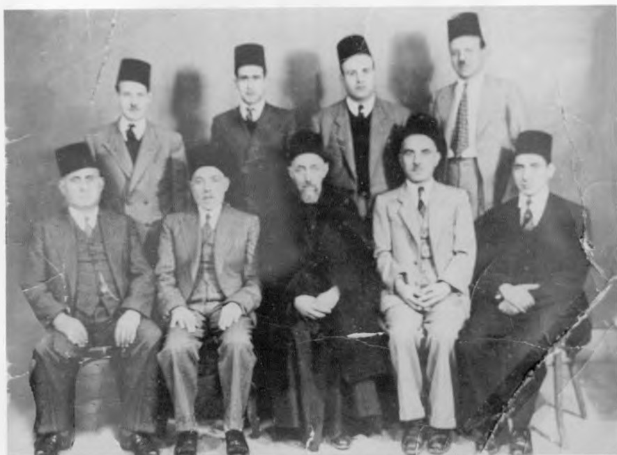
חברים בוועד הקהילה בדמשק (1945-46).