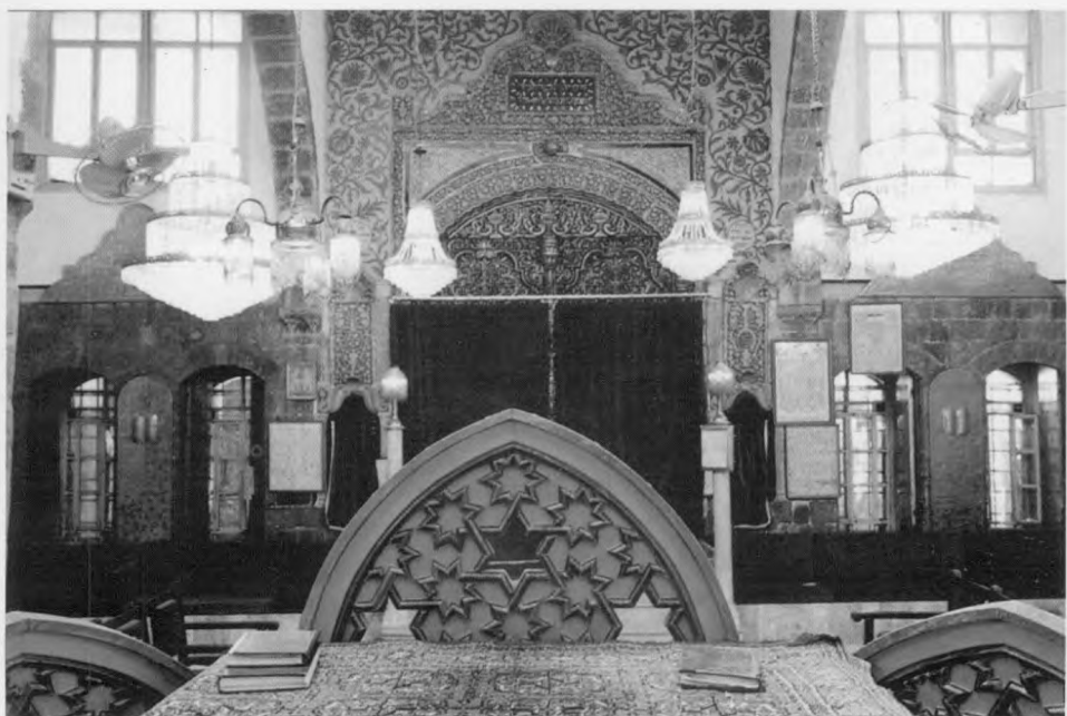
בית הכנסת אלפרנג' (דמשק 1994).