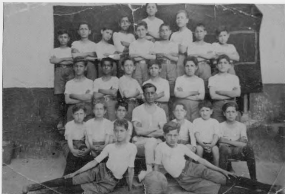
תלמידים בבית הספר כתאב שבשכונה היהודית בדמשק.