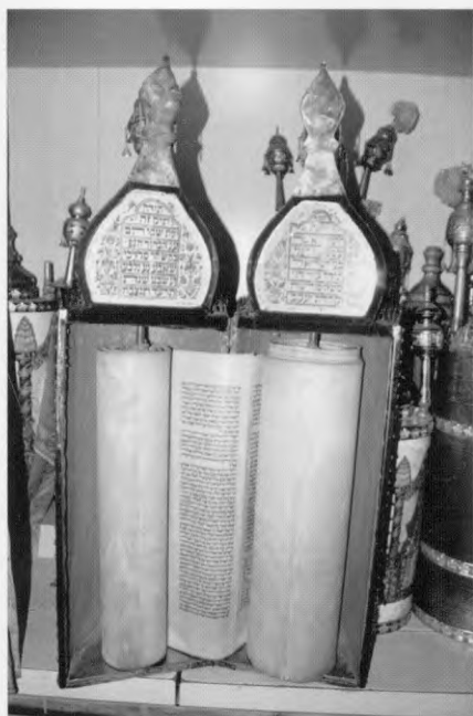
ספר התורה שהיה מוצב בבית ההורים בדמשק.