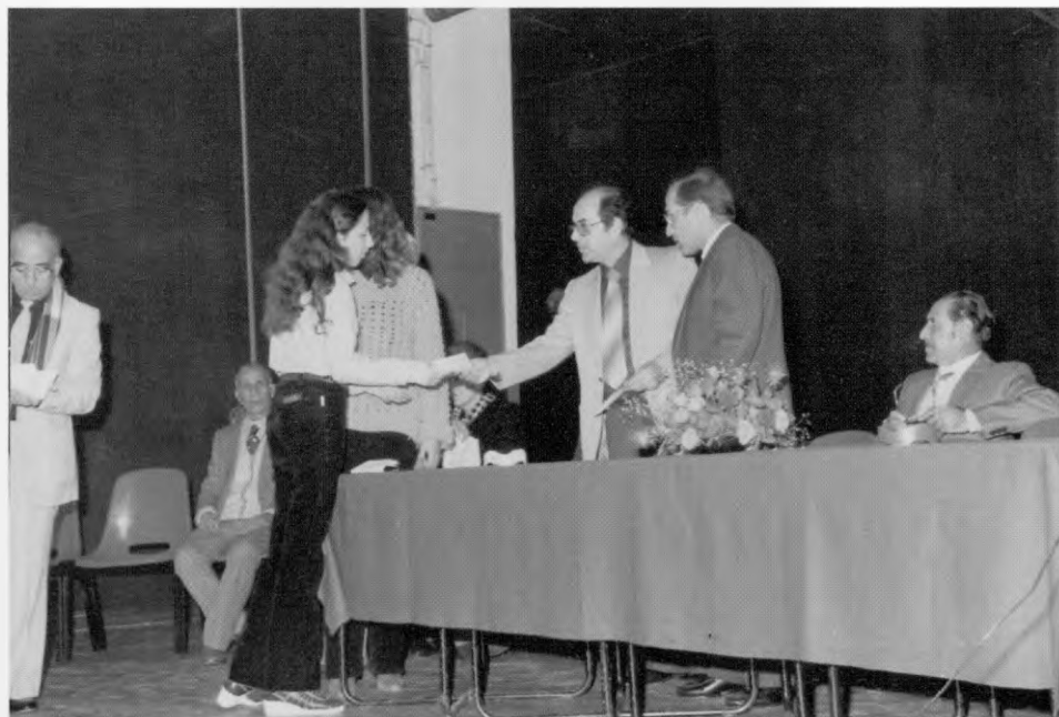
טקס חלוקת מלגות מטעם ארגון יוצאי דמשק-סוריה בישראל.