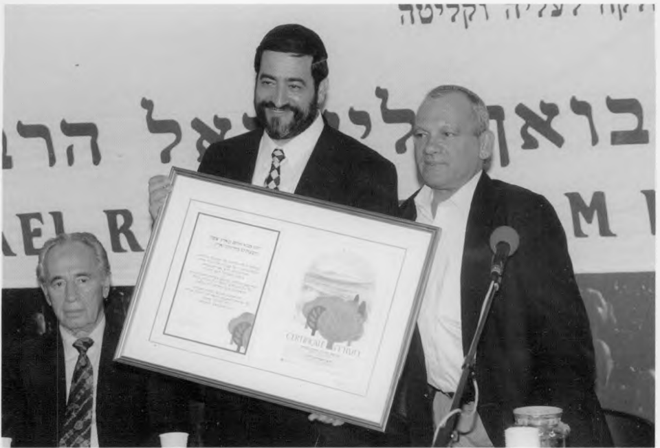
הרב חמרה ביום עלייתו ארצה עם אורי גורדון ושמעון פרס.