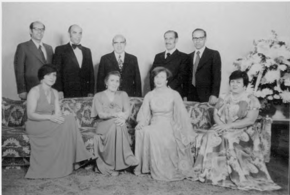
האם עליזה וילדיה.