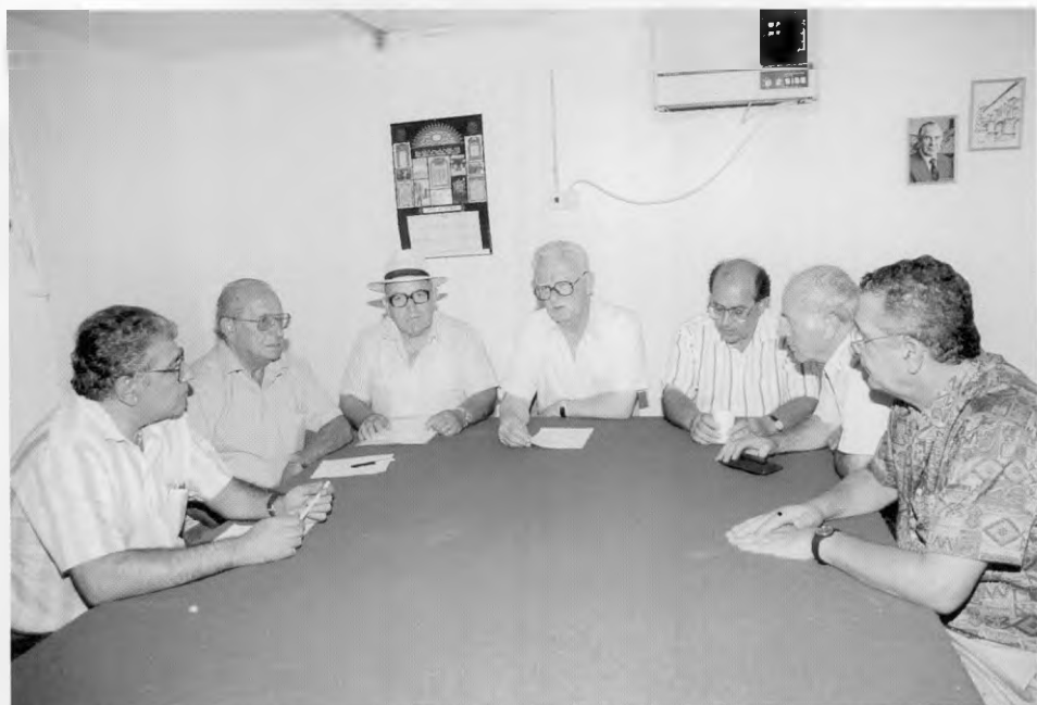
חברי הנהלת התאחדות יוצאי סוריה.