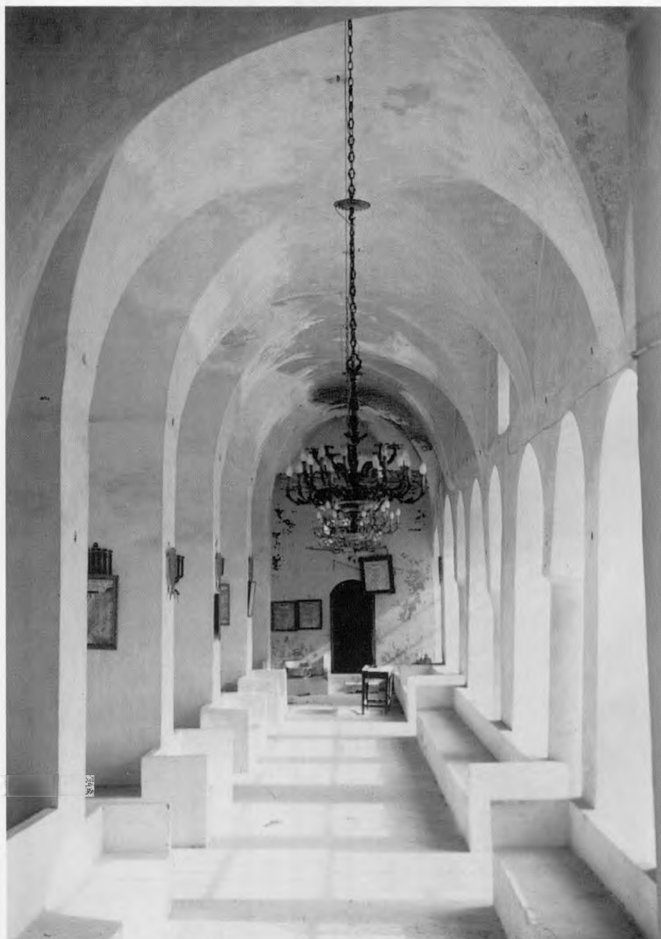
בית הכנסת העתיק בחלב, ארם צובה (1994).